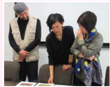
◀ 応募作品の審査の様子(写真部門)