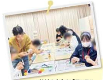
▲地域の先生やボランティアと一緒に、ものづくりにも取り組んでいます