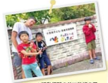
▲活動場所の前で笑顔の子どもたち

子どもや若者、その家族らが自分らしく過ごせる居場所づくりを目指し、小豆島内の2拠点でワンストップ相談や子ども食堂、子ども宅食、送迎サポート、季節のイベントなど、さまざまな活動を行っています。これまで延べ約8000人が利用。今後も他機関と連携して多岐にわたるニーズに応えるほか、「ファミリーサポート」など地域みんなで子育て・子育てを支えられるシステムの導入・構築を進める予定です。