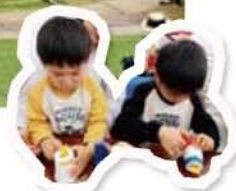
▲絶好の行楽日和の中、大勢の親子でにぎわいました