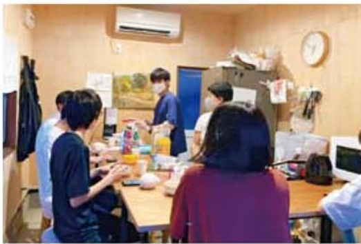
▲「もののパー」では、かき氷を作ったり食べたりしながら交流しています