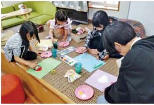
▲週2~4日、異なる年齢の子どもが集まり、お絵かきなどをして過ごしています