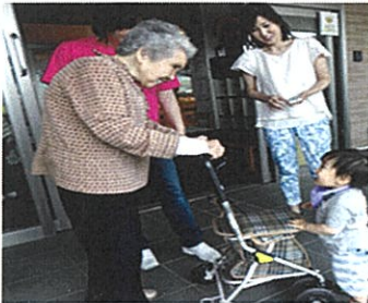
～デイサービスの利用者さんと～